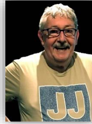
Jean-Jacques Gonin PHOTOGRAPHY

Vernissage Artiste – Dégustation de vins